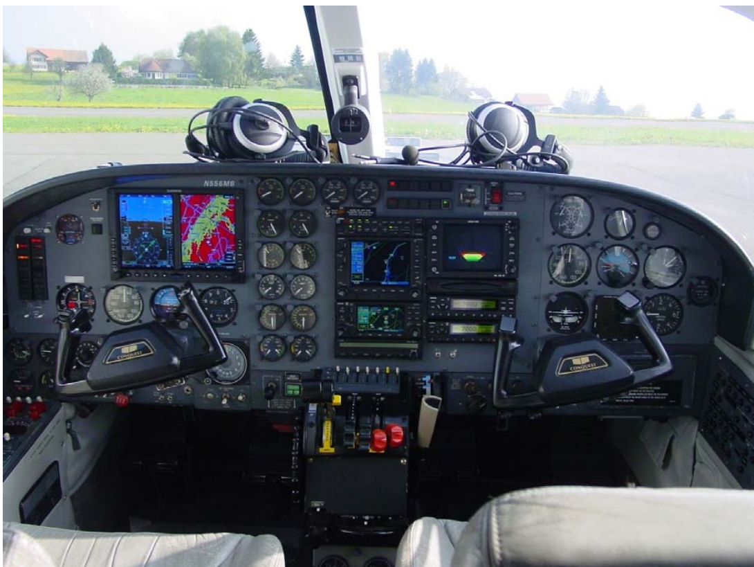
Tableau de bord du N556MB