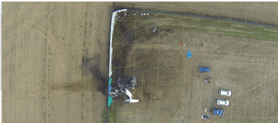
Vue aérienne du site de l'accident

L'avion s'est immobilisé en limite nord de l'aérodrome, à l'intérieur de son enceinte, en bordure de la clôture, à 400 mètres environ au nord-ouest de l'extrémité de la piste.