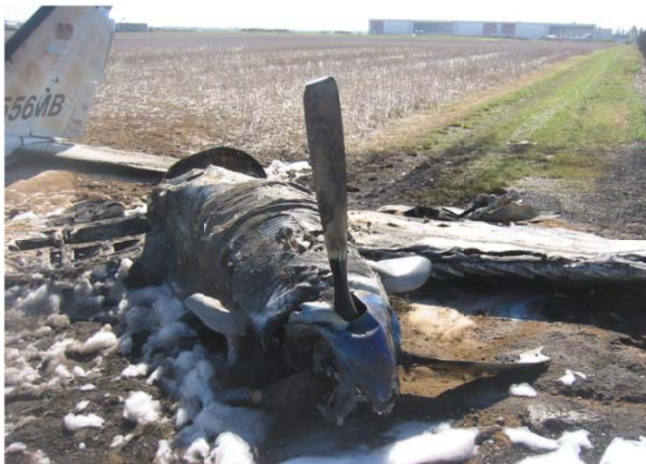
Hélice gauche avec une pale intacte