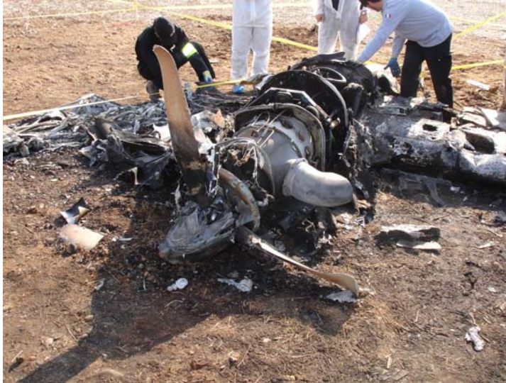
Hélice droite légèrement déformée vers l'avant

Les moteurs sont équipés d'hélices tripales. L'examen visuel de ces hélices montre une légère dissymétrie : les pales du moteur gauche sont faiblement endommagées (deux sur trois sont presque intactes), indiquant peu de rotation à l'impact. Celles du moteur droit sont légèrement déformées, indiquant une rotation plus significative sur ce moteur.